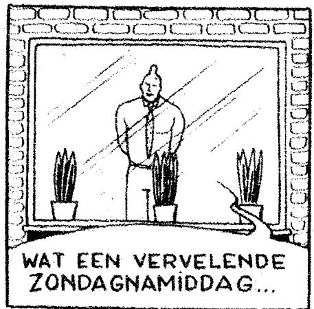
WAT EEN VERVELENDE ZONDAGNAMIDDAG...